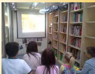
Baranya megyei Könyvtárbusz 1.

341 település regisztrált ez idáig a portálon.