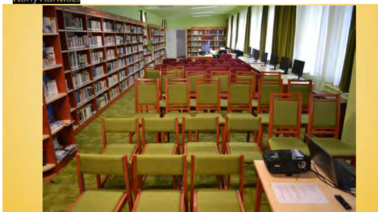
Kunadacs – Könyvtár, Információs, Közösségi Hely